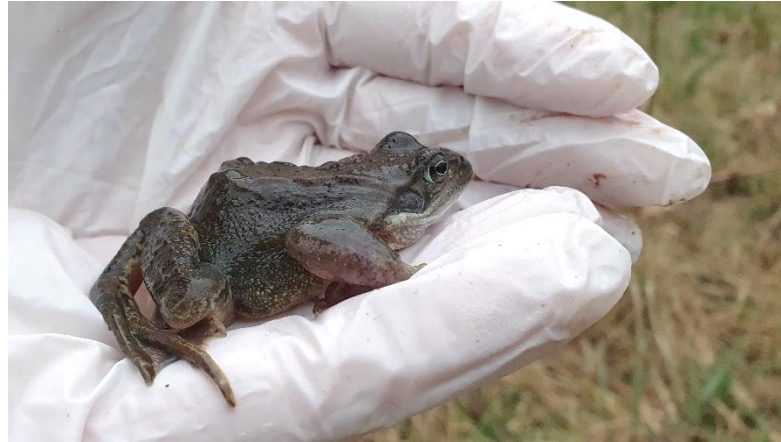
Feuersalamander und Braunfrosch