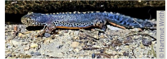
Bergmolchmännchen im Wasserkleid