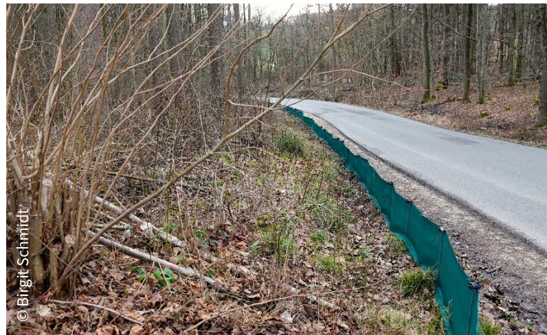
Straße hinunter zum Merzenbach