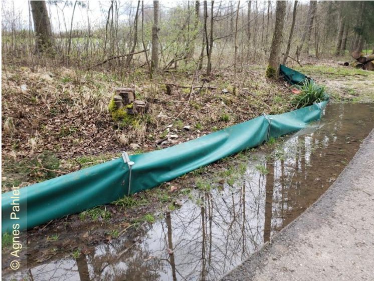
9. April 2023: Wasser staut sich