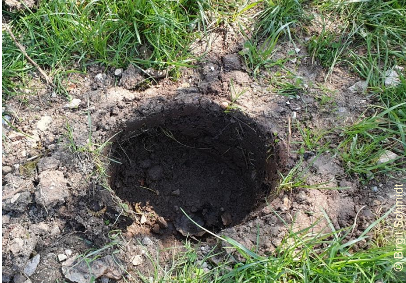
4. April 2023: Eimer entfernt, Löcher nicht aufgefüllt