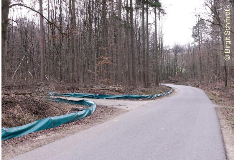
Straße in Richtung Pliezhausen-Dörnach