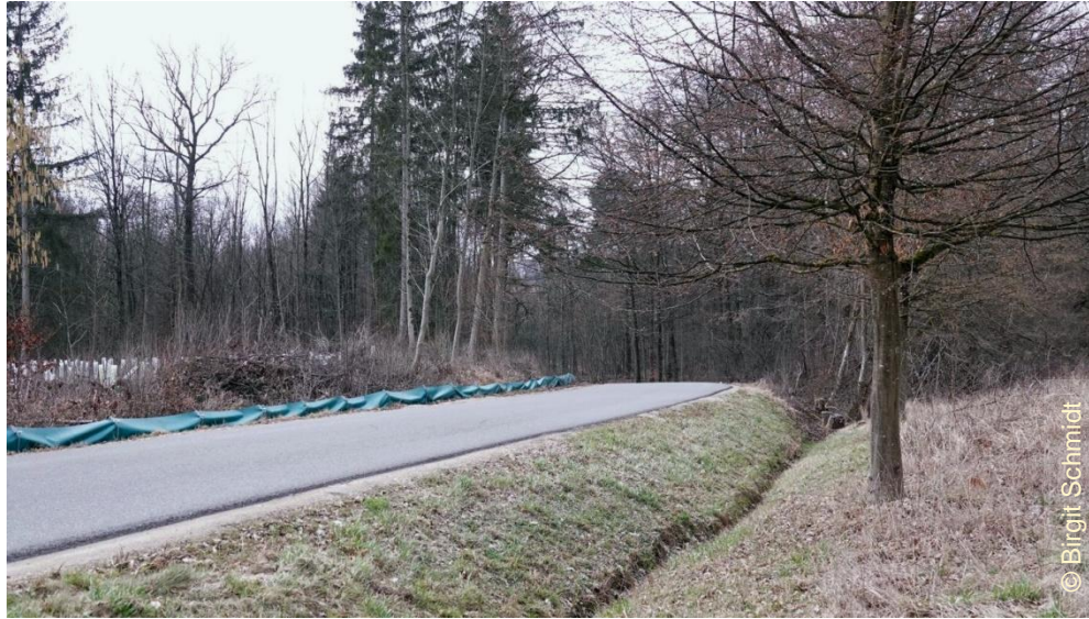
Böschung und Wassergraben