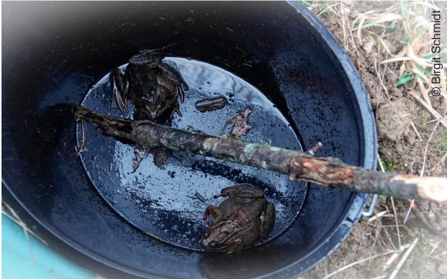
Eimer mit Stock