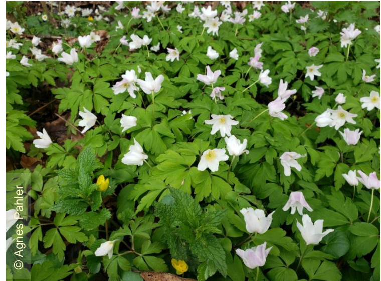
9. April 2023: Buschwindröschen