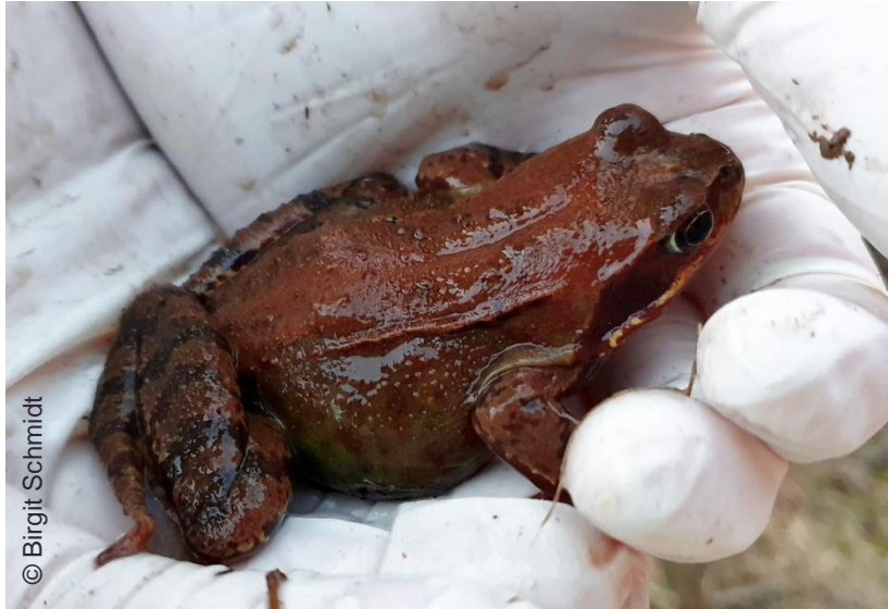
Handschuhe zum Schutz der Tiere