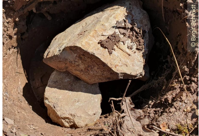
5. April 2023: Löcher mit Steinen befüllt