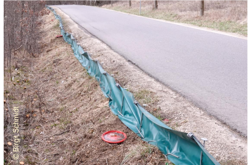
Böschung, noch geschlossene Eimer