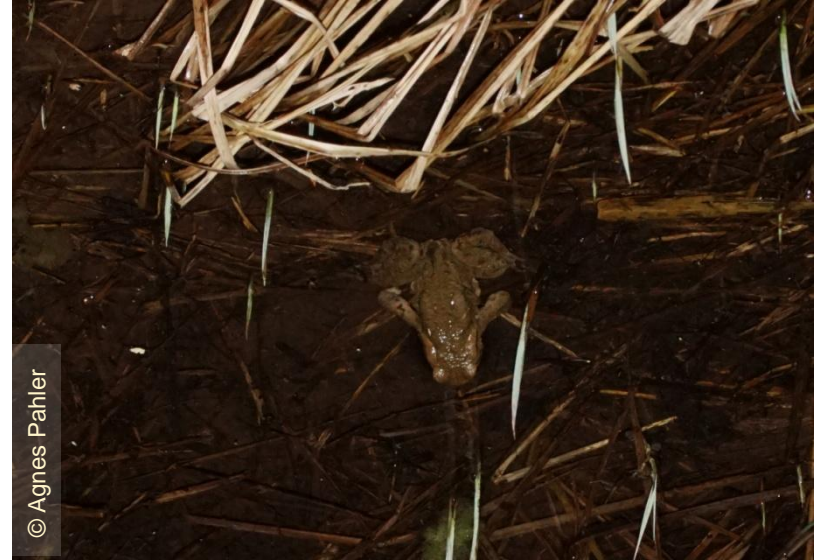
Abtauchen ins Wasser