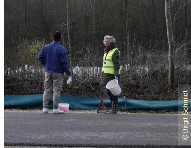
Kontrolle von außen